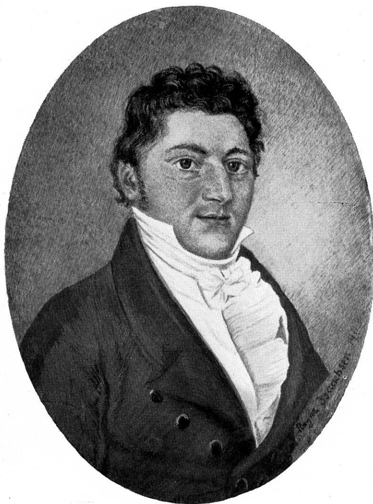
STIFTSAMTSKRIVER HAGBARTH DE FALSEN