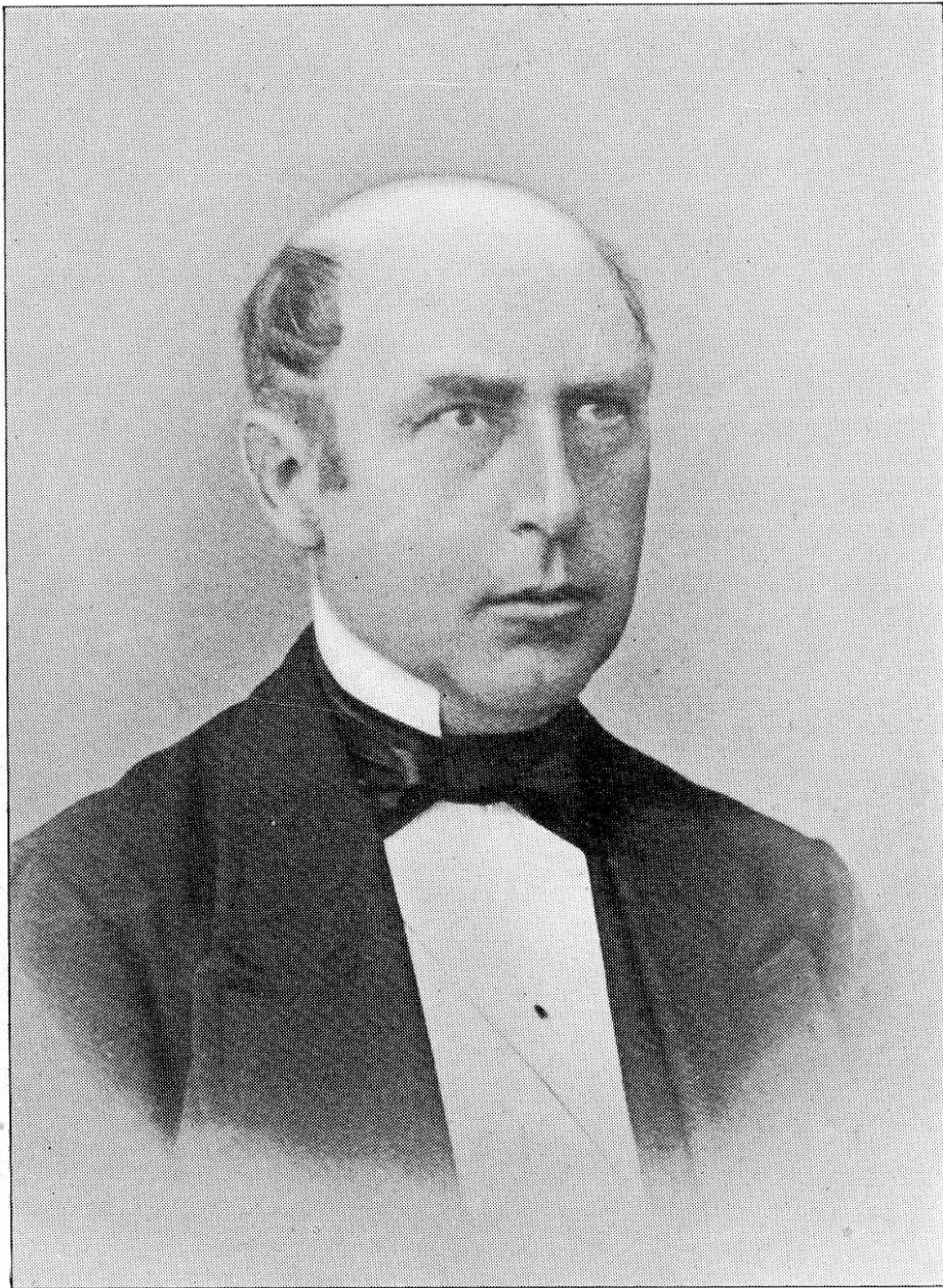
STATSRAAD JOHN COLLETT FALSEN